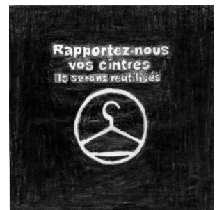
© Christine Crozat, Saif cliché Jean-Louis Losi