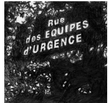
De la gare de Caen au musée des Beaux-Arts, 2009