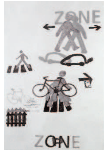
La préhistoire est toujours là, 2007 © Christine Crozat, Saif – cliché Jean-Louis Losi