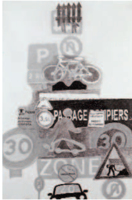
Hommage à Jacques Tati, 2007 © Christine Crozat, Saif – cliché Jean-Louis