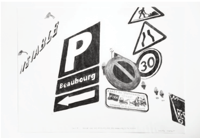
Signalétique provisoire 2006-2007