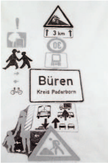
Arrêt à Büren, 2007 © Christine Crozat – cliché Jean-Louis Losi

Musée des Beaux-Arts de Caen Et à partir de là Christine Crozat