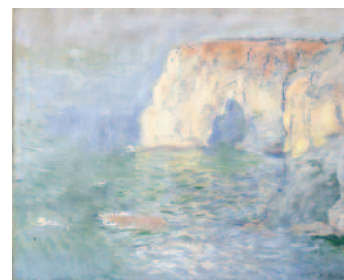
20 Claude Monet Étretat, la Manneporte Étretat, la Manneporte