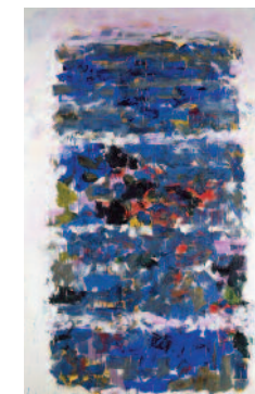
24 Joan Mitchell Champs Fields