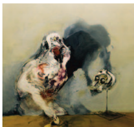
23 Paul Rebeyrolle Pas de question No question