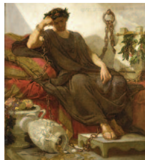
17 Thomas Couture Damoclès Damocles

> Retour au rez-de-chaussée, par les escaliers A B C ou par l'ascenseur > Return to the ground floor, by the staircases A B C or by the lift