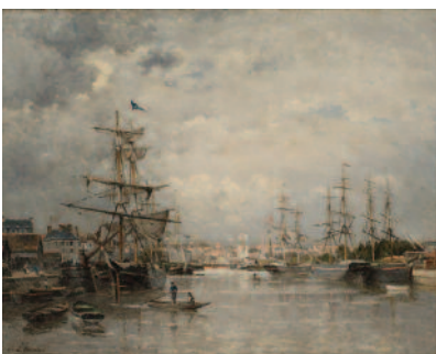
18 Stanislas Lépine Le Port de Caen The Port of Caen