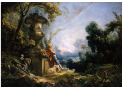
16 François Boucher Pastorale Pastoral